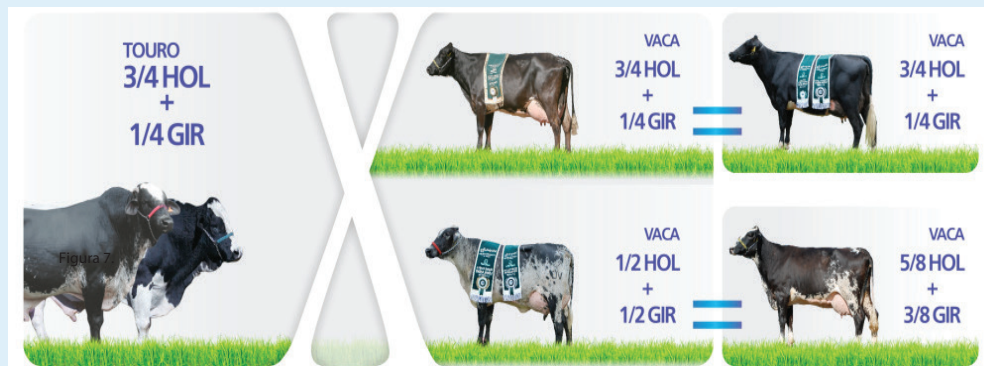
Figura *. Cruzamentos mais utilizados com touros Girolando 3/4.