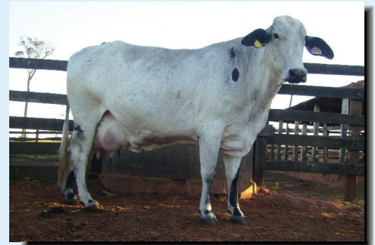
Madre de Concerto