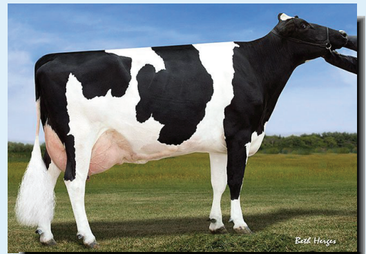
Hija de Bolton