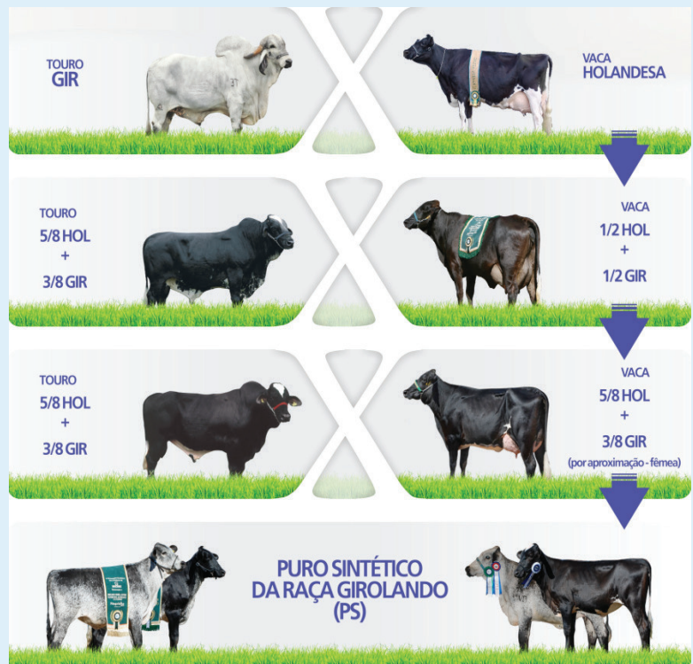
Figura 4. Estratégia de cruzamento para a obtenção de animais PS, utilizando touro puro Gir na primeira geração e touros Girolando 5/8 nas duas últimas gerações.