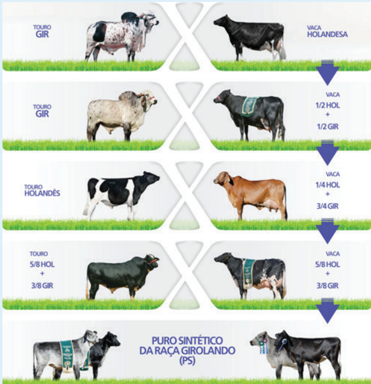
Figura 2. Estratégia de cruzamento para obtenção de animais PS, utilizando nas três primeiras gerações touros das raças Gir e Holandesa e touro Girolando 5/8 na última geração.