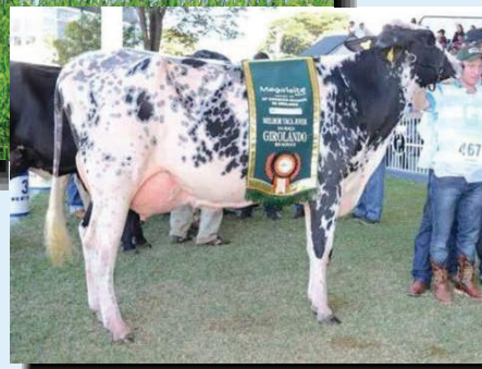
Madre de Projeto