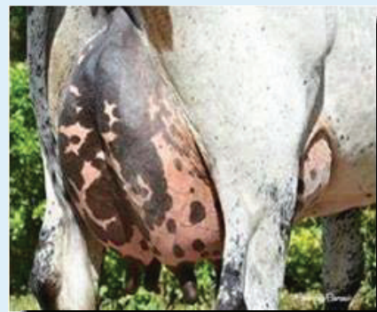
Hija de Projeto, MEJOR UBRE ITAPETININGA y SAO JAO DE BOA VISTA, SAO PAULO