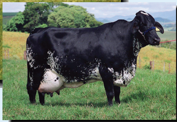
Quartinha Terra Vermelha