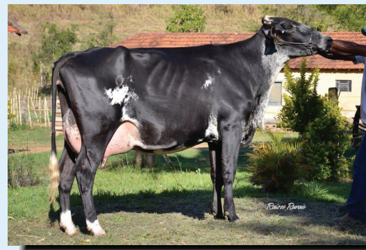
Hija Girolando de Atwood