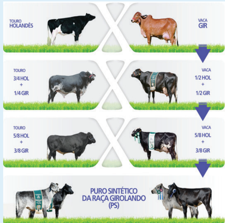
Figura 3. Estratégia de cruzamento para a obtenção de animais PS, utilizando touro da raça Holandês na primeira geração, touro Girolando 3/4 na segunda geração e touro Girolando 5/8 na terceira geração.