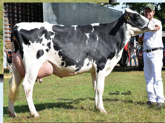
Hija Girolando de Atwood