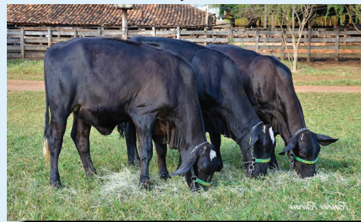
Hijas Girolando de Atwood