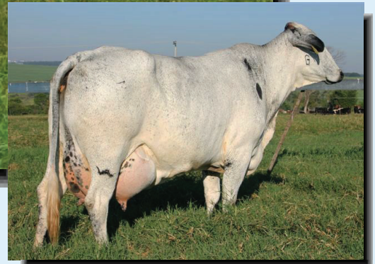
Madre de Concerto